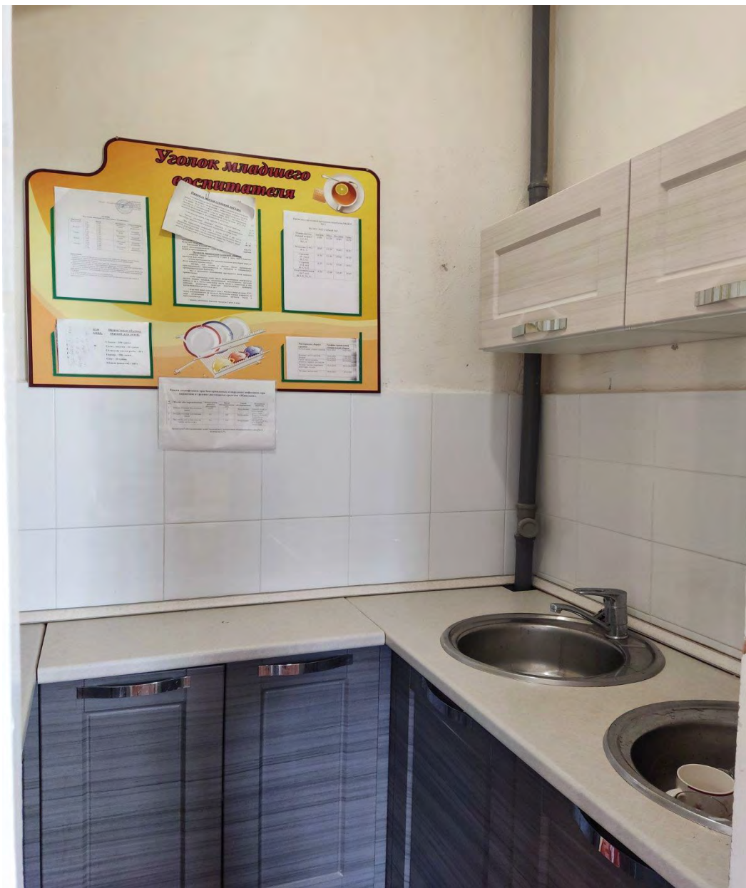
Безопасные условия труда помощника воспитателя

Все рабочие места в ДОУ соответствуют требованиям охраны труда