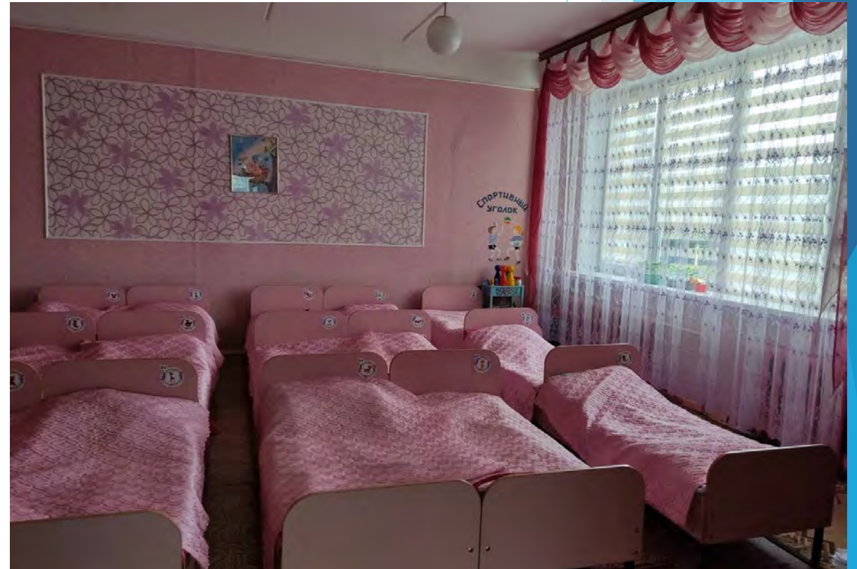
Светлые спальные комнаты